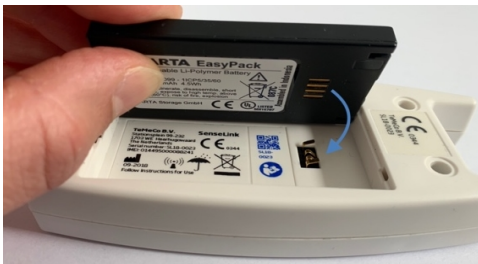
Afbeelding 3: correct verwisselen accu

Let op: voelt u dat het klepje niet goed dicht gaat? Controleer dan of u de accu juist geplaatst heeft (zie afbeeldingen 3 en 4).