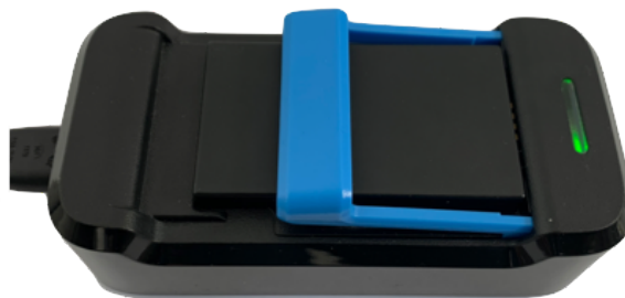
Afbeelding 6: volledig opgeladen accu