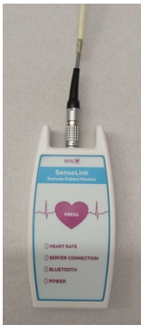
Afbeelding 7 recorder met kabel

De eventrecorder is niet waterdicht. Wanneer u gaat douchen of baden, haalt u de kabel van de plakkers. Haal de stekker van de kabel niet uit de recorder (zie afbeelding 7 en 8).