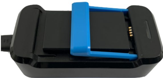
Afbeelding 5: onjuist geplaatste accu

U krijgt een oplader mee naar huis om de meegeleverde accu's mee op te laden. Het is belangrijk dat u de lege accu uit de recorder oplaadt. Zorg ervoor dat de accu goed in de oplader geklikt wordt. Gemiddeld duurt het opladen van een accu 2 uur . Zodra het lampje van de oplader continu groen brandt, is de accu volledig opgeladen (zie afbeeldingen 5 en 6).