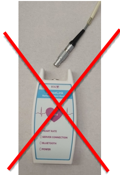
Afbeelding 8 recorder met kabel eruit

Leg de recorder met de kabel op een plaats waar ze droog blijven. De plakkers haalt u voor of tijdens het douchen / baden voorzichtig van de huid. De gebruikte plakkers kunt u weggooien.