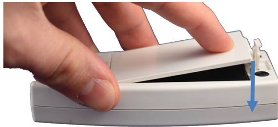
Afbeelding 4: correct sluiten van het klepje