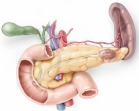
Pancreasstaart vóór de operatie