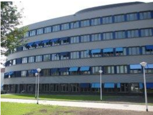
Het Vrouw Kind Centrum (VKC)

We begrijpen heel goed dat één van je eerste vragen is hoelang de opname van je baby gaat duren. Dit is erg afhankelijk van de opnamereden en de conditie van je baby. In de eerste dagen zullen de artsen en verpleegkundigen je over de verwachte opnameduur informeren.